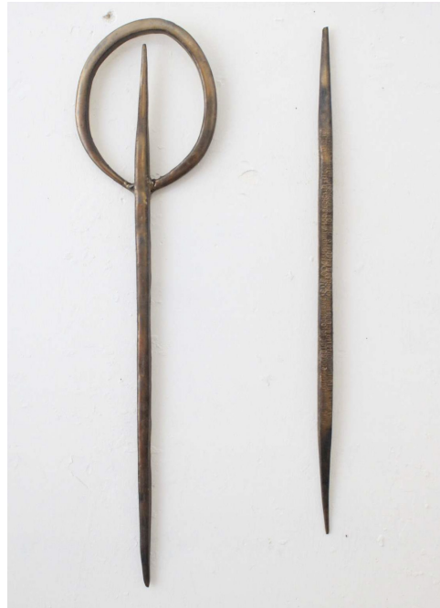
Artefacto #22, 2025, Grés vidrado.

A exposição Apócrifos evoca simultaneamente o familiar e o misterioso, habitando um espaço encenado que sugere uma descoberta quase arqueológica de