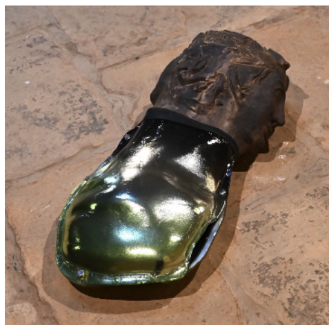
JANUS, 2024, Daphne Klagkou. Cerâmica de grés, esmalte metálico, vidro de janela, espelho, lacas. 22 x 30 x 68 cm Cortesia de Daphne Klagkou.

As obras apresentadas incorporam estas ideias, criando um diálogo entre a vida e a morte, a natureza e a atividade humana, tal como a identidade, interligadas e dependentes da passagem do tempo. Deste modo, as obras de Hybrid Realities: Identity and Transition enfatizam reflexões sobre a importância das transições profundamente interligadas, como parte de uma narrativa maior, e de uma existência híbrida.