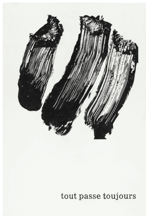
Klaus Mosettig, Typeface Corona 53 , 2021, graphite over paper, 88.2 x 61.2 cm.

To this extent, Mosettig's written words reflect, not only the graphical element of writing, but also the connection between language and the social events that influenced the artist, manifesting themselves in artworks with peculiar visual and linguistic qualities. Despite the strong composition that contains expressions of gestures and drippings, Klaus Mosettig complements this imagery through drawn words that function either as a caption or as possibilities for narrative interpretations.